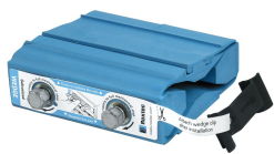
Klin i zestaw C Wedgekit